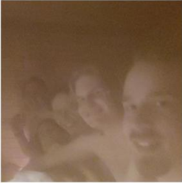
Kuva 2 Hyvät löylyt saavat hyvälle tuulelle. Kuvassa saunan iloista käyttäjäkuntaa.

8. marraskuuta kiuas saatiin jälleen korjattua ja löylyt jatkuvat edelleen.